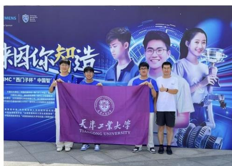
全国总决赛特等奖“轻舟已过万重(3)”队

2024年8月11日至15日，教育部第十八届CIMC“西门子杯”中国智能制造挑战赛全国总决赛在浙江省湖州市举行，我校学子在本次竞赛中取得了优异成绩，斩获全国总决赛特等奖1项、一等奖3项。